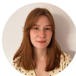
Zuzanna Jacewicz Ilustracja